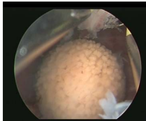
Piedra en la vejiga

Las piedras pueden formarse en cualquier órgano de la vía urinaria riñón, vejiga, y en el caso del hombre también en la próstata. Una piedra puede tener su origen en el riñón y desplazarse por el uréter (conducto de transporta la orina del riñón a la vejiga) hacia la vejiga o formarse en ésta ultima sin haber salido del riñón.