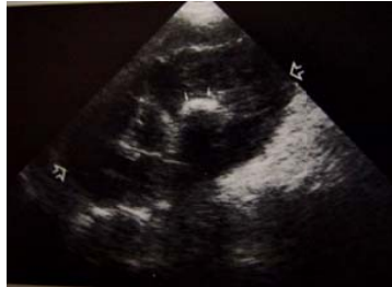
Ultrasonido renal que muestra un cálculo en riñón

que forma la infusión sino el líquido que esta contiene y que uno consume (AGUA), y si el enfermo prefiere tomar tres litros de té estará bien ya que serán 3 litros de agua que es lo que el paciente necesitara. Podemos sugerirle que en caso de no gustar de la ingesta de agua sola consuma agua de frutas naturales, ya que siempre será el agua lo importante.